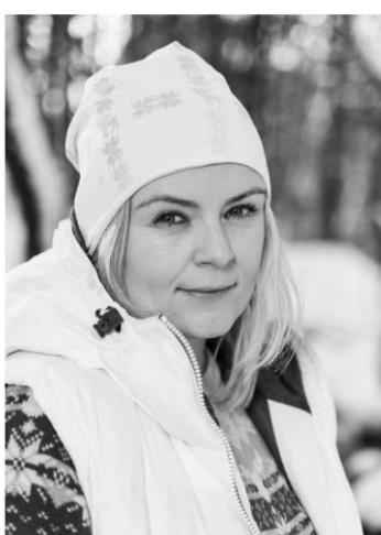
● 46 | | DN MAGASINET | 2. FEBRUAR 2019

- Å bevare plagt fra Stormberg er en sterk ytring. De som er usigig i å dese vil bevare uten setter symbolisk på på holdningene til næringslivet er farlig nær bokbale fra Europas markerte nærhistorie? - Noks få ble veldig sinte. Vi har fått tusenvis av kommentarer og henvendelser som ulven - det eneste et emne med oss i at det må være plass til ulven i Norge. Det er synd at folk på sosiale medier velger den harske og harde uttrykkformen. Det er bedre om de da puster plagene i butikkene våre. Ellers gir dem til gjernik. - Klike naturvitenskapelig peker på vi er inne i enda sjette store stridslinje. Atter det ut masser av antall. Vi går kanskje selv med i dragspelt, sammen med ulven. Bør vi ikke heller bare bli dekadente? Nye ferden mot det nye undergangstid nyttre jo ikke. Ekberg protesterer mildt, uten opphisselse. Hun bemerkter med bekymringsstemme at vi må løse klimaufordringene sammen. Alle kan gjøre litt. Litt er det viktigste. De fører et årlig klimaregnskap der hele verdensdelen til plaget er med. Fra svinnproduksjon til at kunden gir trett av det. Stormbergs utslipp gir turt og jevnt nedover. - Målet er nullvisjon. I mer enn 13 år har vi vært klimanøytral, og vi arbeider hele tiden med å teste nye og enda mer miljøvennlige produksjonsmetoder og materialer. Det vi forurenser kompenseres vi med